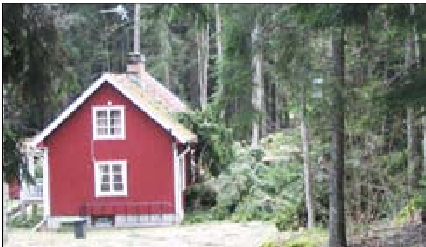
Klubbstugan träffades av nedfallna träd med klarade sig förhållandevis bra.

Det är inte bara vår tävling som ställs in i vår. FK Finn i Ljungby ställer också in sin tävling den 1 maj, här är i stort sett all skog nerblåst. Växjö OK har på ett sent stadium tagit beslutet att ställa in sin tävling den 17 april. Kalmar OK flyttar fram sin tävling till detta datum och hoppas på en snöfri