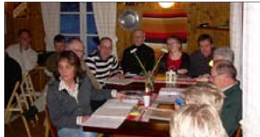
Dektagarna delades upp sektionvis. Här sitter ungdomssektionen och planerar inför det stundade orienteringsåret.

efter vinteruppehållet. En del av årets program planerades sektionvis och viktiga datum spikades. En ändring av tilläggspoängen i poängpriset beslutades också.