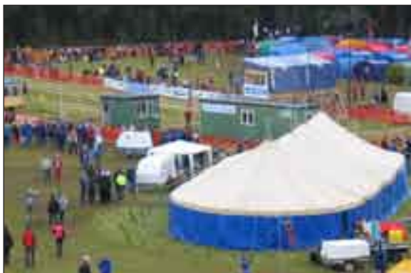
TC, med serveringstältet i centrum, från ovan.

Köerna till och från serveringsborden skulle utmärkas med skyltar som det stod ”in och ut” på, och dessa hade utformats på ett minitiöst sätt och sattes upp på sedvanligt sätt. Men efter det att några funktionärer grunat en stund och kommit med olika sorters kommentarer så blev det vissa problem. Bland annat så kolliderade in-kön med en annan in-kö, samt att skyltarna hade blivit för stora, så att det var risk för att folk kom att slå huvudet i dessa. Näväl! Nya skyltar fixades på nolttid och sattes upp. Men