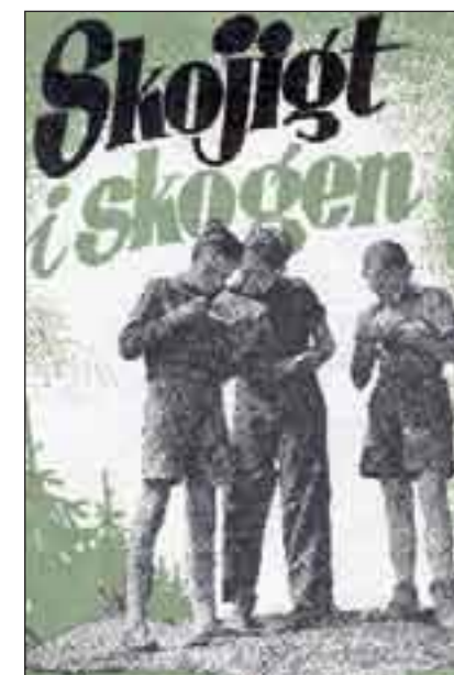
Orienteringshandboken "Skojigt i skogen" från 1955.